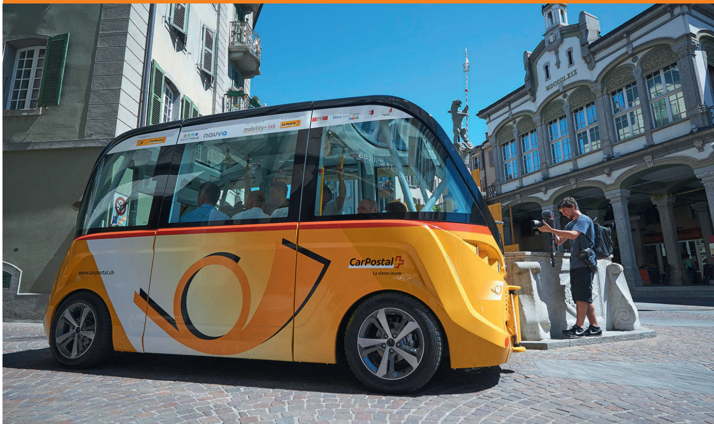
Ein Versuchsbetrieb mit selbstfahrenden Postautos läuft in Sitten bereits seit Sommer 2016.